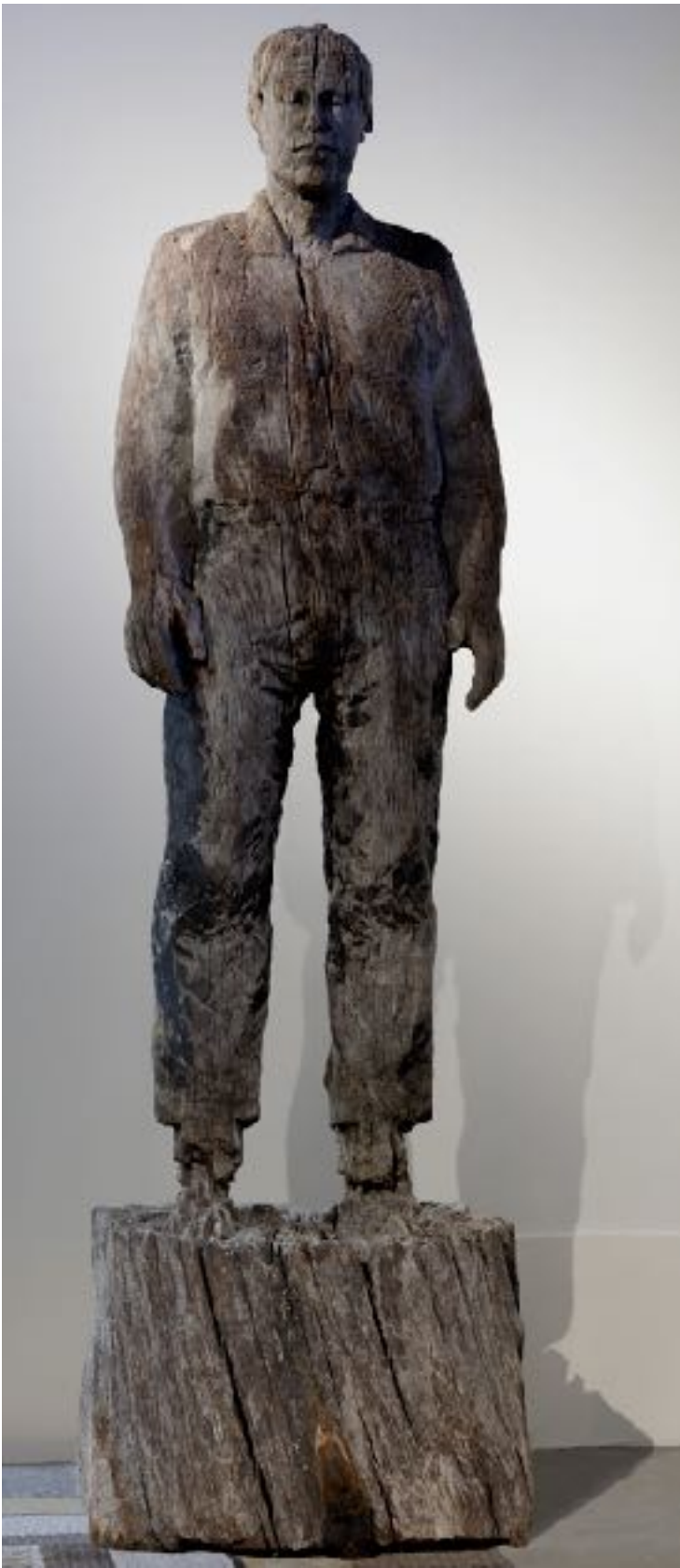
Stephan BALKENHOL, L'Homme sur sa bouée , 1993 Bois 2,20 x 1,50 x 0,80 m