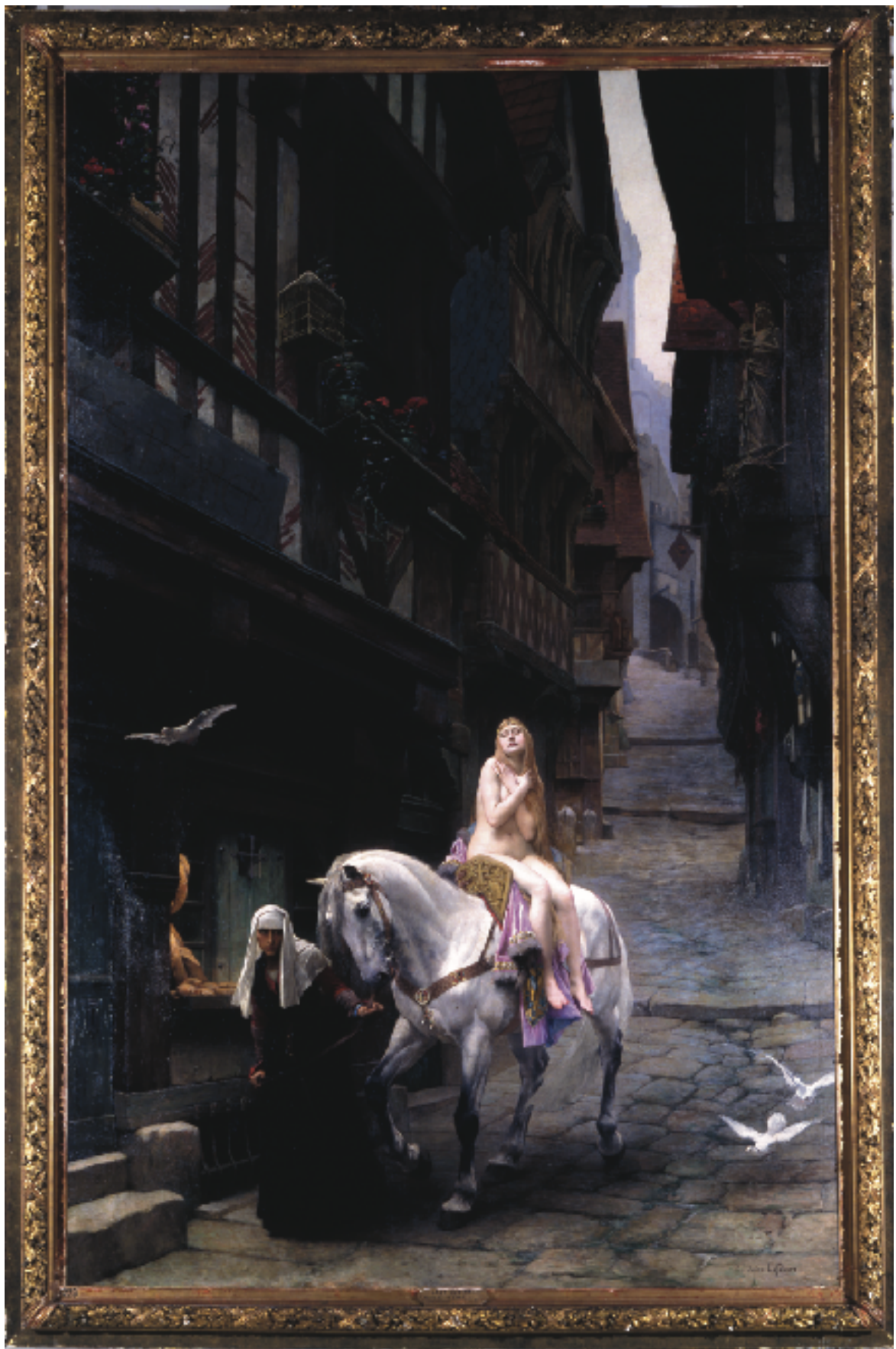
Jules LEFEBVRE Lady Godiva , 1890 Huile sur toile 620 x 390 cm