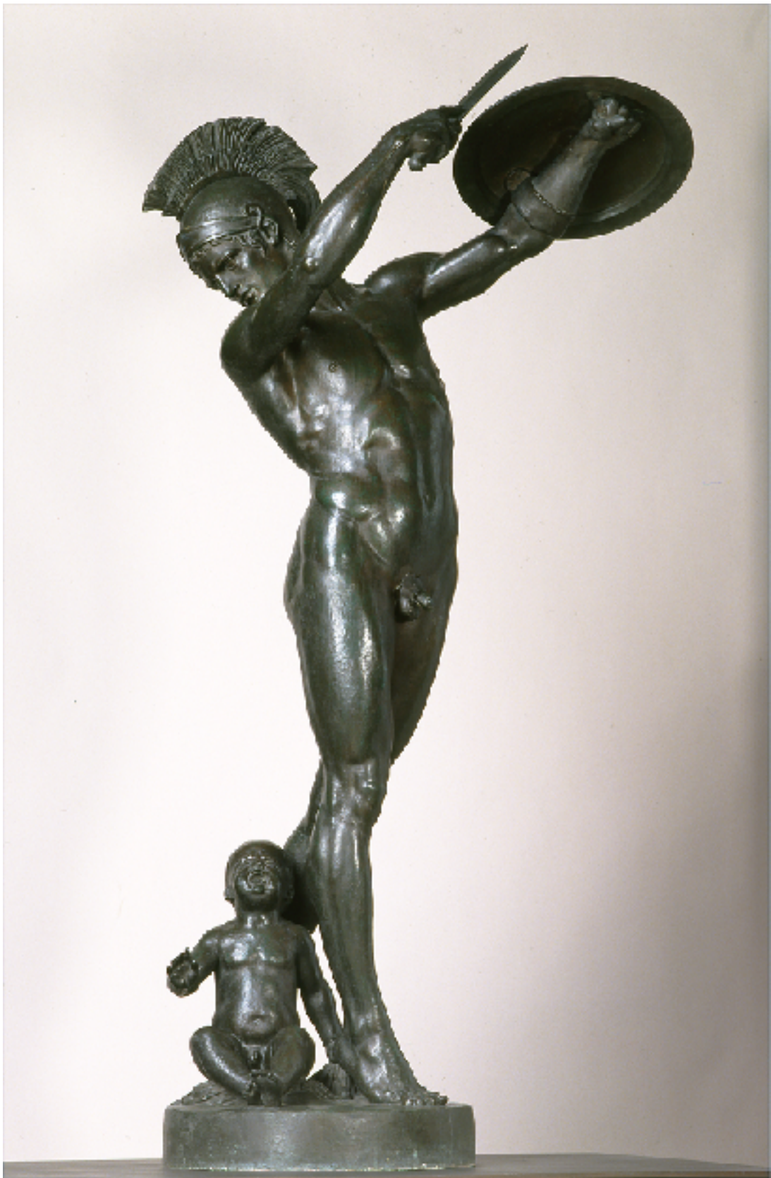
Louis Léon CUGNOT, Corybante étouffant les cris de Jupiter enfant , 1867 Bronze H. 2,16 L. 0,59