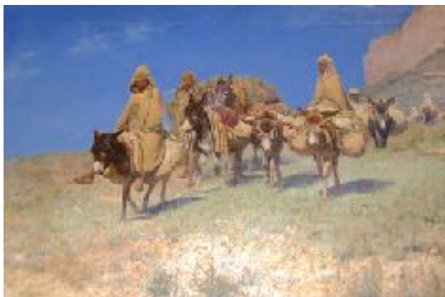
LOUIS MAURICE BOUTET DE MONVEL Retour du marché - Kabylie , 1882 Huile sur toile 114 x 158 cm