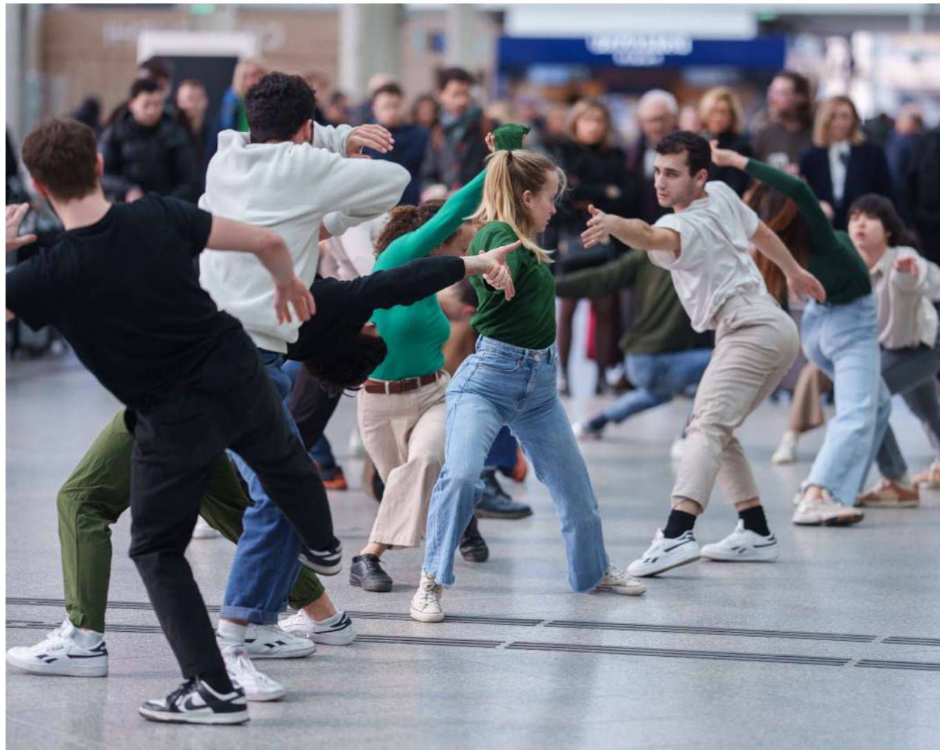
Chorégraphie poétique proposée par le Jeune Théâtre du Corps