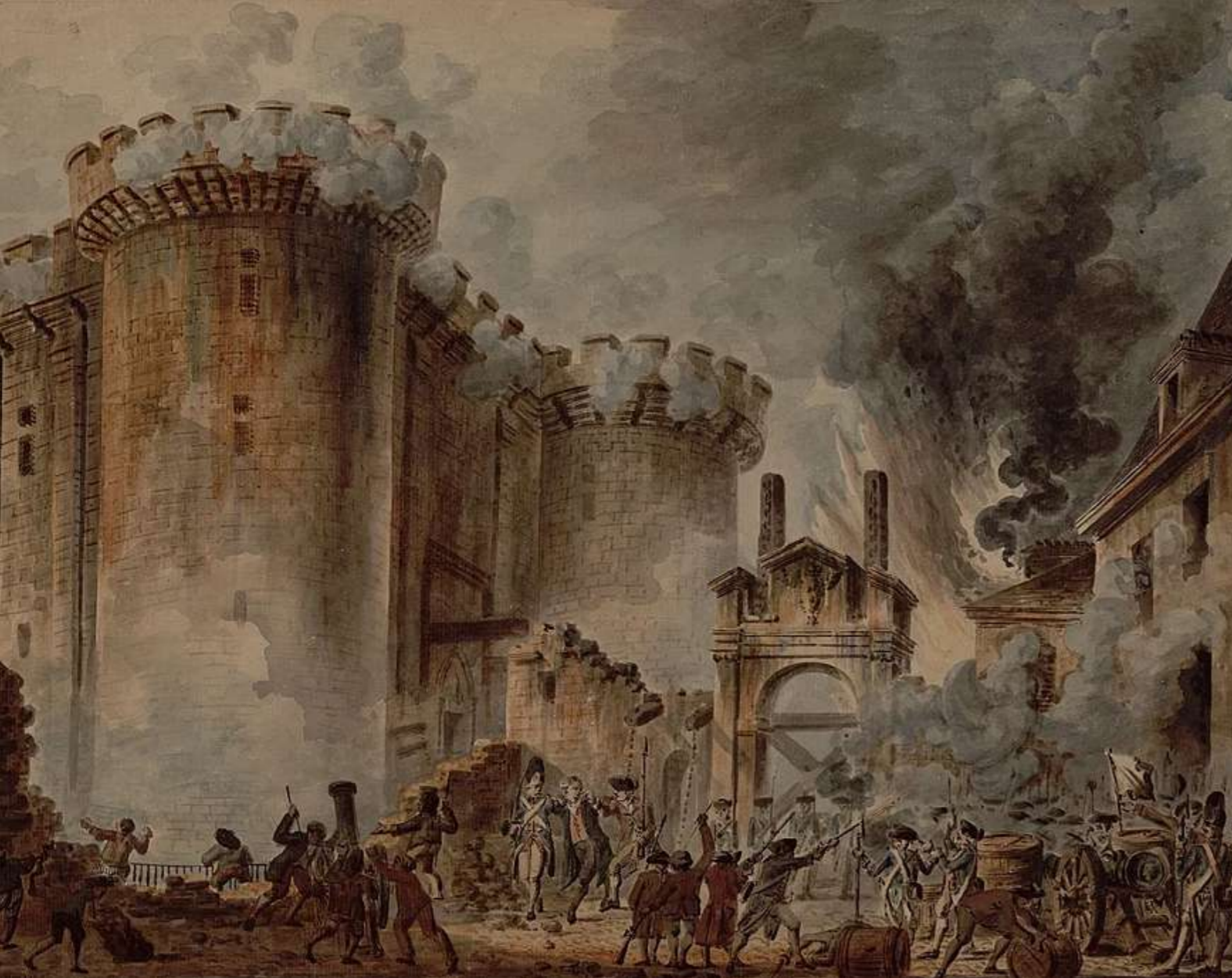
détail de La Prise de la Bastille (1789) par Jean-Pierre Houël