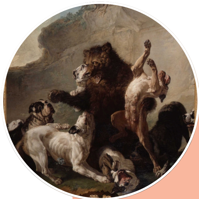
Jean-Jacques Bachelier, Un Ours en Pologne, arrêté par des chiens de forte race, 1757, Musée de Picardie