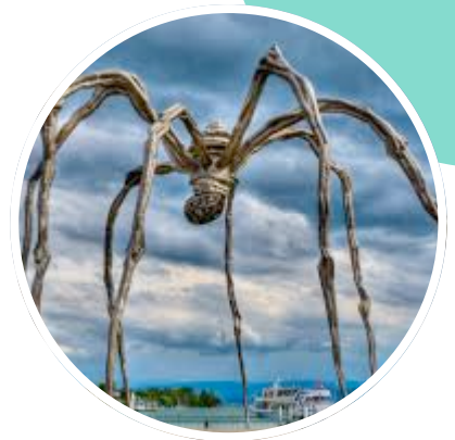
Louise Bourgeois, Maman, 1999