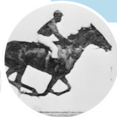
Muybridge, The Horse in Motion , 1872