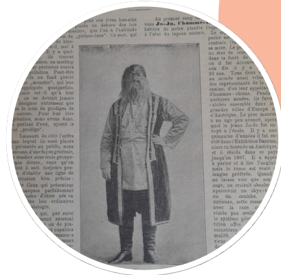
Jo-Jo, L'homme chien

Une représentation réaliste d'un ours tout puissant. Dressé sur des pattes arrières, c'est un adversaire à l'égal de l'homme. Menaçant, il est le seul sujet du tableau. Encerclé et traqué, ce fauve prédateur livre un combat désespéré contre une meute de chiens. Jusqu'au Moyen Âge, c'est l'ours qui était le roi des animaux. Le lion a pris sa place ensuite.