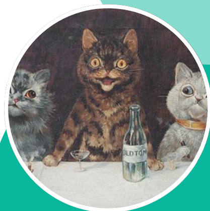
The bachelor party - Louis Wain (1860-1939)