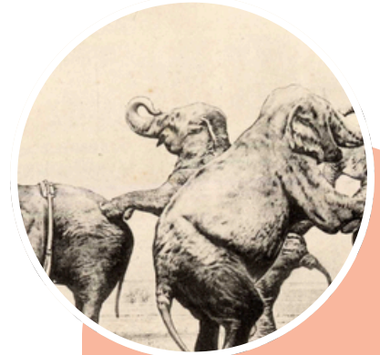
Souvenir de Barnum et Bailey