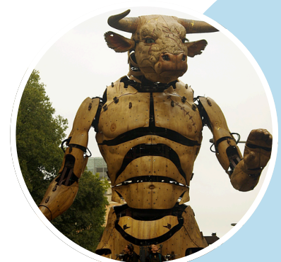
Astérion le Minotaure dans les rue de Toulouse, Géant de la compagnie "La Machine", 2018

Choisir une figure animale emblématique de l'Antiquité grecque ( le Minotaure, Pégase, les oiseaux du lac Stymphale, le chien Cerbère...) ou romaine (l'aigle impérial, la louve du Capitole ...) . Créer une scène de tragédie ou de comédie autour d'un animal symbolique de cette période. Concevoir des masques inspirés du théâtre antique. Jouer cette scène.