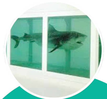
Damien Hirst The Physical Impossibility of Death in the Mind of Someone Living, 1991