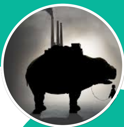
Affiche du film Okja, Deviant Art