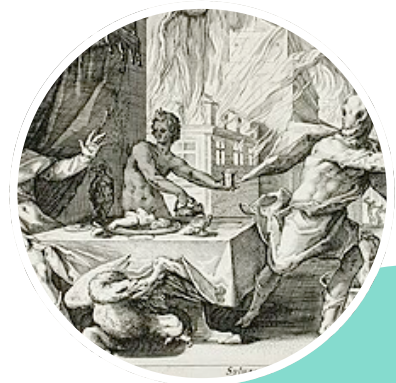
La métamorphose de Lycaon, illustration d'Hendrik Goltzius