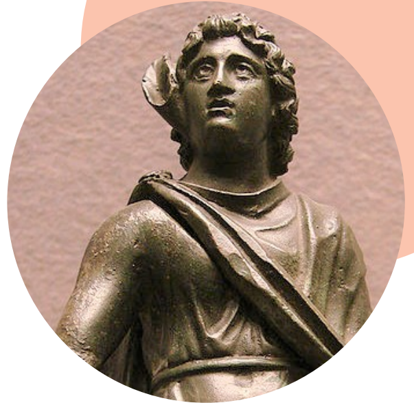
Statuette d'une divinité à l'oreille de cervidé, fin du 1 er siècle

Ces représentations ont continué à nourrir les artistes jusqu'à l'époque contemporaine.