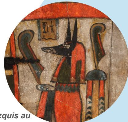
Représentation du dieu Anubis, musée de Picardie