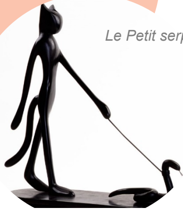
Le Petit serpent, Alain Séchas, 1999

Pour s'interroger sur la signification de la figure de l'hybride, entre tradition littéraire, interprétation plastique et signification symbolique.