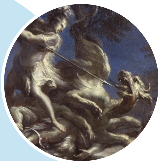
Cadmos combattant le dragon , vers 1710, Giacomo del Po, Musée de Picardie