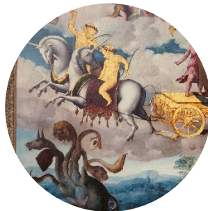
Puy de 1548 - Triumphe exquis au chevalier fidele