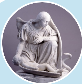
L'Ange gardien , 1833, Antoine Desboeufs, Musée de Picardie.

Sur le modèle des Surréalistes, travailler autour du cadavre exquis, par l'écriture, le collage, le dessin.