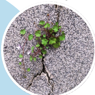
AVD, Tentative d'évasion