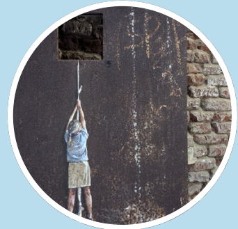
collectif CURB Citadelle de Doullens