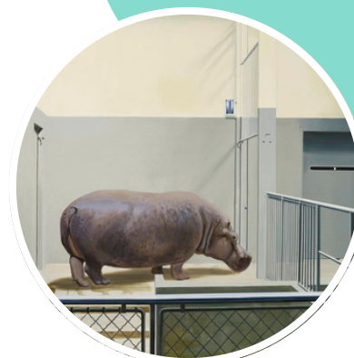
Gilles Aillaud, Intérieur et hippopotame , 1970