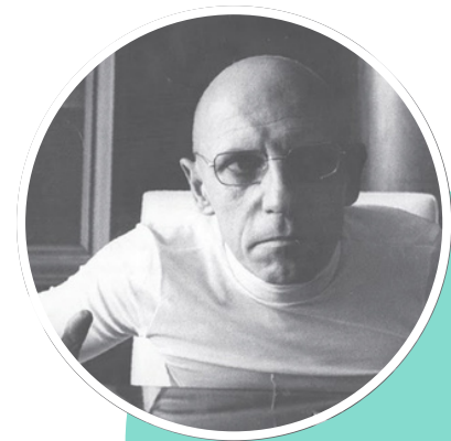
Foucault, La tactique de l'enfermement