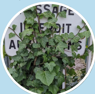
AVD, Tentative de fuite

Autour de vous, observer des plantes qui semblent tentées de s'échapper d'un espace urbain. Effectuer des recherches sur les espèces végétales identifiées. Proposer une sonorisation de l'image.