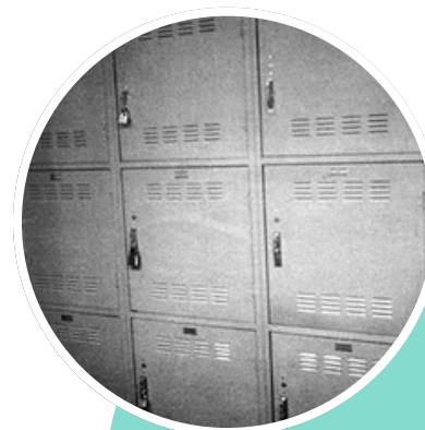
Chris Burden, Five day locker piece , 1971