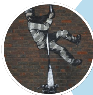
Banksy, prison de Reading

Dans l'enceinte de l'établissement scolaire, réaliser une œuvre in situ évoquant l'évasion. On peut s'inspirer du pochoir de Banksy sur les murs de la prison d'Oscar Wilde (prison de Reading en Angleterre), ainsi que cette œuvre street art de l'exposition permanente "Quand l'art rentre au mitard" du collectif CURB à la citadelle de Doullens.