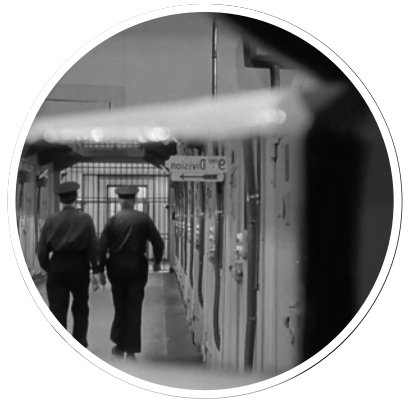
Le Trou, analyse de scènes