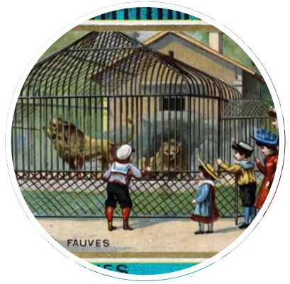
Faire l'histoire : "Le zoo, toute une vie en cage"