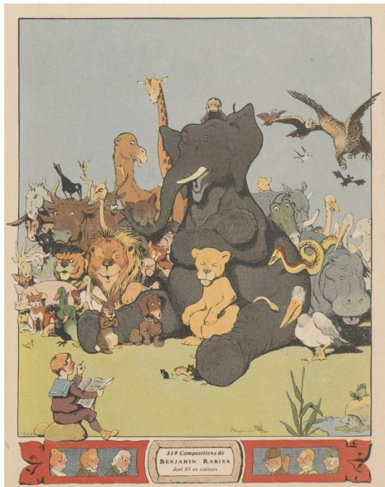
Le Bestiaire de Benjamin Rabier, 1906

Oiseau. Désirer en être un, et dire en soupirant : « Des ailes ! Des ailes ! », marque une âme poétique.