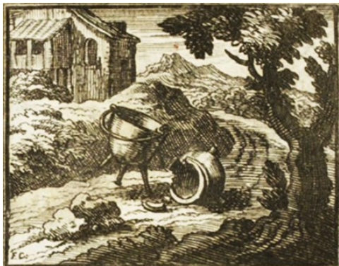
Le Pot de terre et le Pot de fer, par François Chauveau, premier illustrateur de La Fontaine (1668)

Les objets héros d'une fable sont assez rares chez La Fontaine, mais on y trouve par exemple « Le Pot de terre et le Pot de fer ». http://www.la-fontaine-ch-thierry.net/poterfer.htm