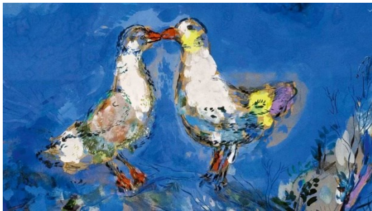
Les deux pigeons, gouache de Chagall, 1925

Après vous être documenté sur le personnage, rédigez à votre gré son éloge, un plaidoyer pour le défendre, http://www.la-fontaine-ch-thierry.net/odauroi.htm ou pourquoi pas, un réquisitoire rédigé à l'instigation de Colbert ? Car sous la Cigale et la Fourmi, peuvent aussi se reconnaître Fouquet et Colbert !