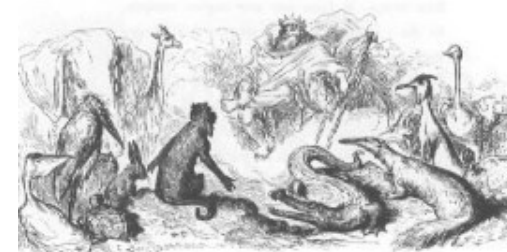
Vignette de Gustave Doré pour La Besace