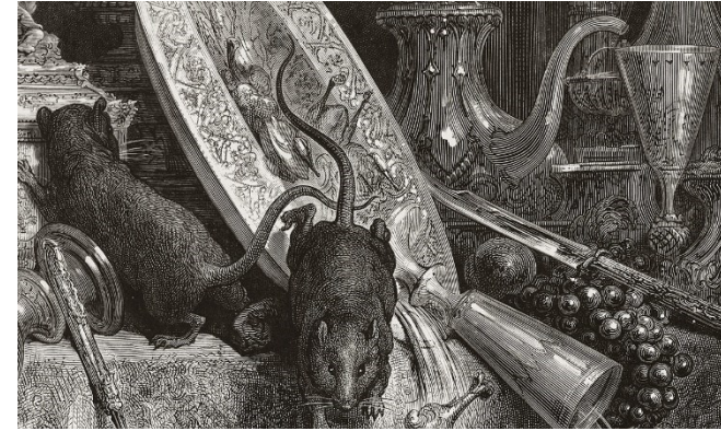
Gustave Doré, Le Rat de villes et le Rat des champs, 1867

Si elle vous bloque, biaisez, détournez, trichez !