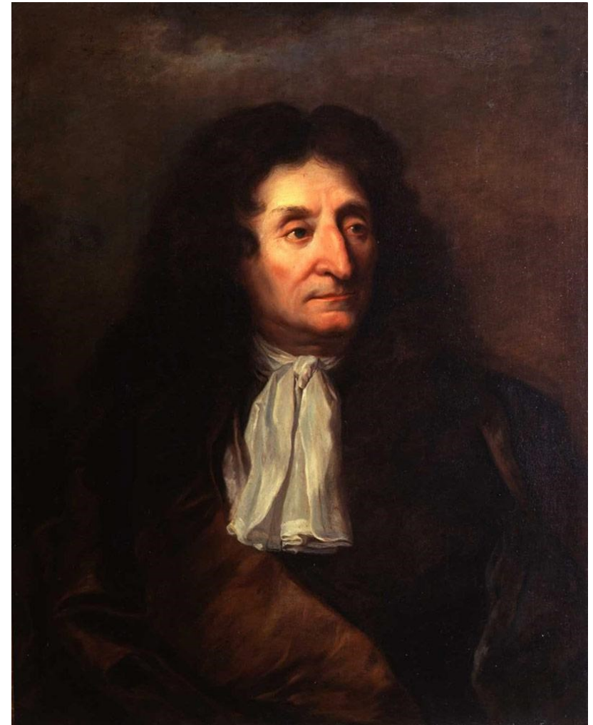
Hyacinthe Rigault, Portrait de La Fontaine , vers 1684 - musée La Fontaine de Château-Thierry

Mais peut-être préférerez-vous traiter zain , zèbre , zen , zèle , ou encore zéro , zig , zone , zoo , zoom ou zut ? Pour clore ces propositions abécédaires, tant pour le sujet que pour la forme, laissez libre cours à votre fantaisie la plus débridée !