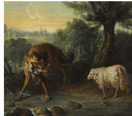
Le Loup et l'Agneau par J.-B. Oudry, édition des Fermiers Généraux, 1755-59

Un poète contemporain de La Fontaine, Isaac de Benserade (1614 – 1691) a publié en 1678 un recueil de Fables d'Ésope mises en quatrains . C'est un redoutable exercice de concision.