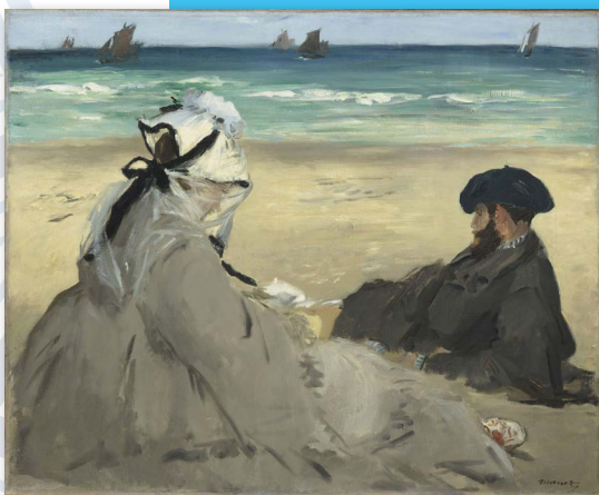
Édouard Manet (1832-1883). Sur la plage, 1873, huile sur toile, 60 x 73,5 cm, Paris, musée d'Orsay.

En 2024, le ministère de la culture et le musée d'Orsay fêtent les 150 ans de l'impressionnisme. En parallèle à l'exposition " Paris 1874. Inventer l'impressionnisme" qui se tiendra à Paris, quelque 180 œuvres prêtées exceptionnellement par le musée d'Orsay sont à découvrir dans plus de 30 musées de France.