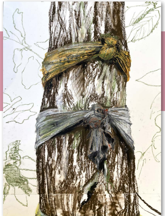
Tereza Lochmann, Dendromagie 1 , 2023, pastel à l'huile sur papier, 330 x 270 cm © Tereza Lochmann, ADAGP 2024

L'exposition s'achèvera sur la présentation des figures féminines liées à des légendes ancestrales ou contemporaines, renouvelant les canons traditionnels de la représentation.