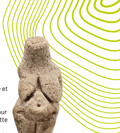
Dame d'Amiens, ~ 27 000 ans, craie Provenance : Amiens, quartier Renancourt, découverte en 2019, H. 4 cm