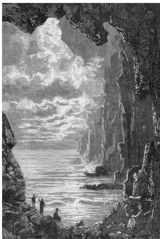
Illustration d'Edouard Riou pour ce chapitre (Ed. Hetzel, 1867)

Vers l'écriture personnelle (après le spectacle):