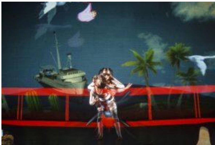
Scène du spectacle correspondant à l'extrait du texte.

Confronter l'extrait du roman aux images ci-dessous.