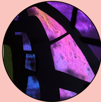
Deux expositions des Archives Départementales