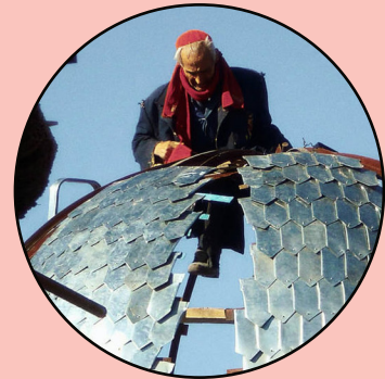
Le spectacle Comment construire une Cathédrale

Lire « Hagard, enquêteur de l'histoire » pour se plonger dans le patrimoine historique de Ribemont-sur-Ancre :