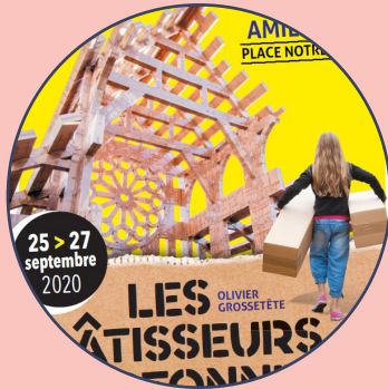
La construction In Situ d'Olivier Grossetête

Étudier notamment ces quelques exemples :